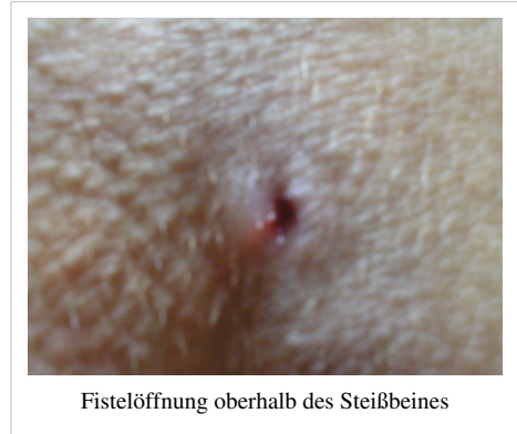
Fistelöffnung oberhalb des Steißbeines

Wird nach der Exzision eine offene Wundbehandlung ( sekundäre Wundheilung ) durchgeführt, resultiert eine lange Krankheitsdauer der Patienten, je nach Größe des Befundes bis zu mehreren Monaten. Die Vakuumtherapie ist eine Methode um eine sekundäre Wundheilung zu