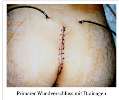
Primärer Wundverschluss mit Drainagen