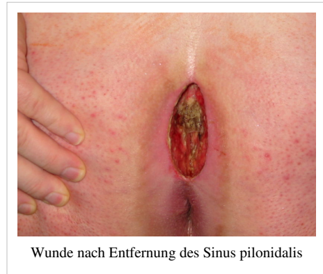
Wunde nach Entfernung des Sinus pilonidalis

Ausgehend von pathophysiologischen Überlegungen wurde von Karydakis ein alternatives Operationsverfahren entwickelt, dessen Kernelement in der asymmetrischen Exzision des Sinus liegt, so dass die resultierende Wunde außerhalb der Mittellinie zu liegen kommt. Mehrere Varianten dieser Operationsmethode, bis hin zu aufwändigen Lappenplastiken (Limberg-Flap) wurden entwickelt, das wesentliche Ziel all dieser Methoden ist die Verlagerung der Wunde bzw. Narbe aus der Mittellinie, um Wundheilungsstörungen und Rezidive zu verhindern. Dadurch lässt sich eine schnellere Wundheilung erreichen.